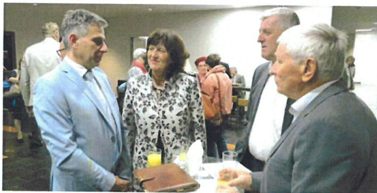
Časa je bilo dovolj tudi za sproščene razgovore ...

Minister Luka Mesec pa se je v nagovoru zahvalil vodstvu, ki je po katastrofalnih polavah v avgustu nemudoma nakazalo denar Karitasu in Rdečemu križu Slovenije, ter dodal, da naj bodo v prihodnje prepričani, da se o invalidih brez invalidov ne bo razpravljalo o ničemer.