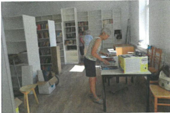
Prostovoljci in prostovoljke Društva upokojencev Škofja Loka so se izkazali tudi pri selitvi knjig v novo Marinkino knjižnico.

V soboto, 2. septembra, je v organizaciji Slovenskega društva upokojencev iz Pliberka, na Pliberškem sejmu oziroma Jormak, kot ga naslavljajo čez mejo, potekalo 29. srečanje upokojencev.