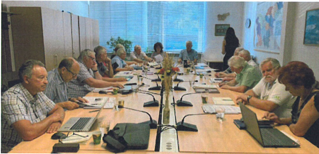
Člani UO novega sklica za mandatno obdobje 2023 - 2027

Na ZDUS-u je 21. avgusta potekala 1. redna seja Upravnega odbora zveze, če ne štejeemo konstitutivne, ki je bila prejšnji mesec. Na tokratni seji so se predstavile tudi nekatere nove pokrajinske predsednice oziroma predsedniki, saj so se ob junijskih volitvah v organe ZDUS mnoga vodilna mesta pokrajinskih zvez izpraznila in potrebne so bile nove volitve pokrajinskih vodstev.