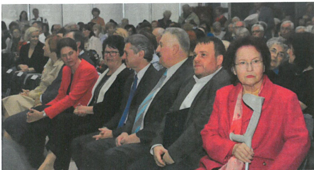
Posebne goste smo posedili v prvo vrsto dvorane

Zaprla so se vrata Marmorne dvorane na GR v Ljubljani. Zastor je padel, a tokrat smo vsi skupaj lahko mnogo bolj veseli odlično obiskanega dogodka, ki smo ga v ZDUS pripravili skupaj z Medgeneracijsko koalicijo slovenije. Robert Golob, predsednik vlade RS je v svojem slavnostnem nagovoru dejal, da so na vladi ta teden zaključili medresorsko usklajevanje štirih ukrepov, vrednih 100 milijonov evrov, namenjenih izboljšanju gmotnega položaja upokojencev. Med njimi je dvig minimalno zjamčene pokojnine na 700 evrov in »božičnica« za upokojence.