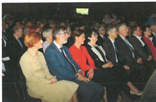
Castni gostje, ministrski zbor RS, gostitelji in vodstvo ZDUS

Letošnji DMS so v ospredje postavili aktualne družbene izzive mladih in starejših. Pripravili smo dve okrogli mizi, prvo na temo pokojninske, drugo pa smo posvetili zdravstveni reformi. Po končani slovesni otvoritvi je predsednik ZDUS predsednika Vlade RS popejpal na ogled vsega, kar smo pripravili za obiskovalce. Ogladala sta si rokodelske mojstrovine naših članov, njihova likovna dela, ki praviloma nastajajo v okviru likovnih kolonij, na