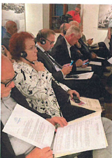
Avtorica na eni od mednarodnih konferenc

V izvajanju letosnjega delovnega programa izstopajo: Povezovanje sekretariata s predstavniki držav predsedstev trojke Svetu EU, da bi se dale teme za starijih v svoje programe in sporocila. Tema teh kontaktov so bila tudi dogajanja v Ukrajini in zavezanje za pomoč tamskajšnim starijem, skupini za katero v začetku spopadov ni imel nihče. Še naprej je v ospredju delo na človeških pravicah starijih in Medsektorne komisije za pridobitev mednarodno obvezujočega instrumenta za njihovo zaščito. Aktualno je skiranje vrsel v obdobju zakonodaj in sodelovanje v organih G20, kjer naj bi nastala Konvencija, med drugimi pa Kanada, Znanje in krasjevo, Nemčija, Avstrija, Italija in Slovenija. Veliko energije je bilo vloženo v pripravo strokovnih osnov za evropsko Strategijo dolgotrajne oskrbe, ki jo je napovedala predsednica EK. Če tem je nekje še razprava o IMBih. Nadajlje se delo na Želeni knjigi s spodbujanjem EK za več uredecev po posameznih področjih. Predstavljati je bil AGE barometer za leto 2021, ki prikazuje, kaj je bil dosežen napredek v potražanju starijih po državah in priprave na Barometer 2023. Aktualno je ugotavljanje uresničevanja dolobč. Evropskega akta o socialnih pravicah, predvsem na področju minimalnega dohodka, kot osnove za Priporočilo Sveta EU. Intenzivno je bilo spremljanje uresničevanja zavezi iz MIRA (Madridskega mednarodnega plana za starije), ki vključa vsakih pet let. V ta proces je bila vključena tudi ZDUS, tako s poročilom nosilcu naloge v Slovenji (MDDSZ)