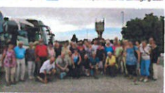
Slovenska fotografija s srečanja