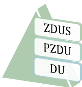
Slika 1 Organiziranost ZDUS

V ZDUS je bilo na 31.12.2021 včlanjenih 13 PZDU . Še vedno ostaja odprto vprašanje članstva Osrednjeslovenske PZDU - MZU Ljubljana, s katero sodni spor še ni zaključen. Njena DU še vedno vodimo v evidenci. V okviru predloga sprememb in dopolnitev Statuta ZDUS pa smo predlagali rešitev za vključitev DU in klubov iz različnih poslovnih okolij in gospodarskih panog, ki niso vključena v nobeno od PZDU.